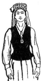
1-rasm. Dastlabki holat.